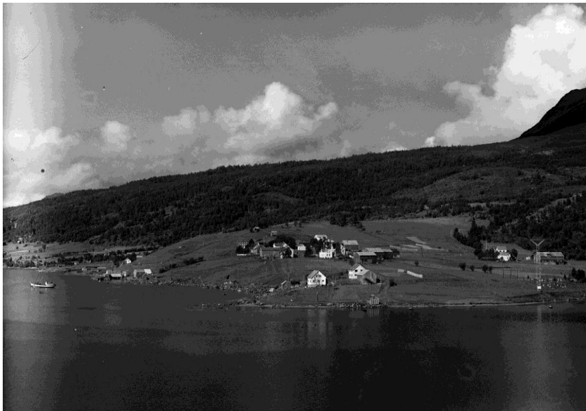
Årstein i Gratangen