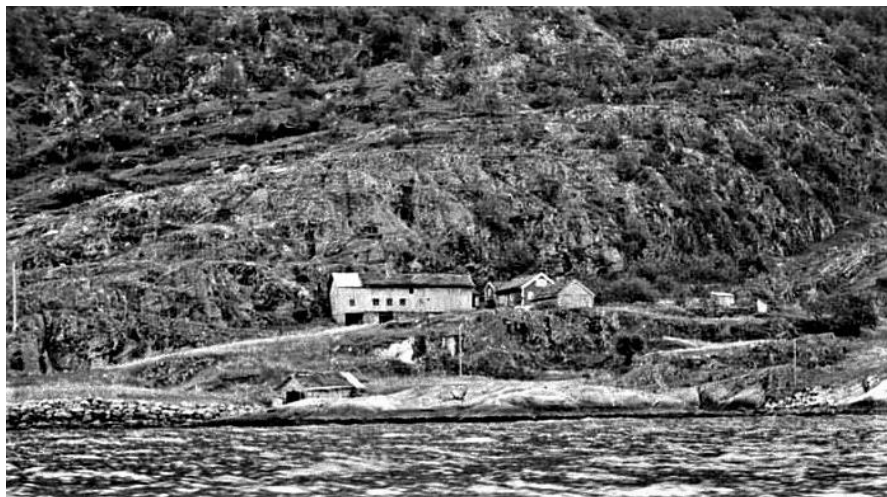
Limmesand, Vik i Sogn