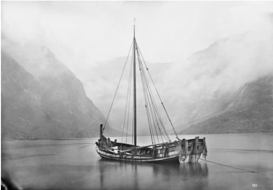
Sognejakt fra 1895